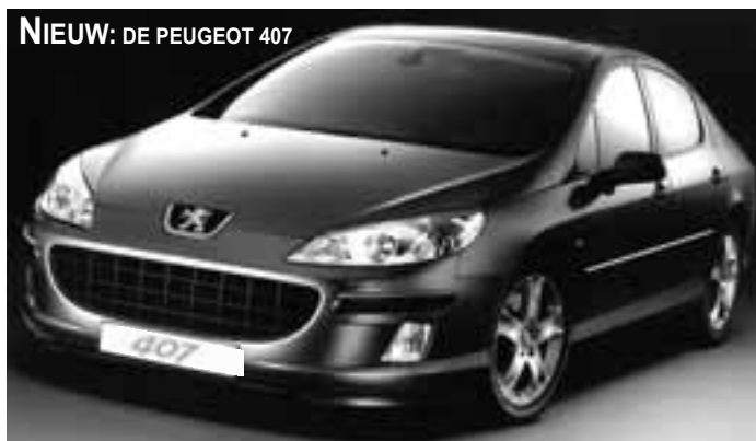
NIEUW: DE PEUGEOT 407