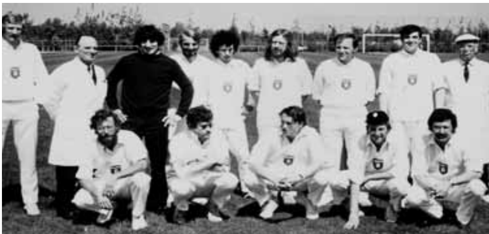
Cricket Heren Een in het eerste seizoen in de hoofdklasse

Echt goed cricketsen kon je in Nederland eigenlijk alleen op het eerste veld van ACC. Zij speelden in Amstelveen op velden die eigendom waren van de Nederlandsche Bank en die waren, gelijk een biljartlaken. Daar ging die off-drive, die je langs de fielder sloeg gewoon voor vier, zoals