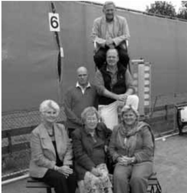
Het tennisbestuur van het eerste uur bijeen rond dezelfde umpires stoel als in 1981.