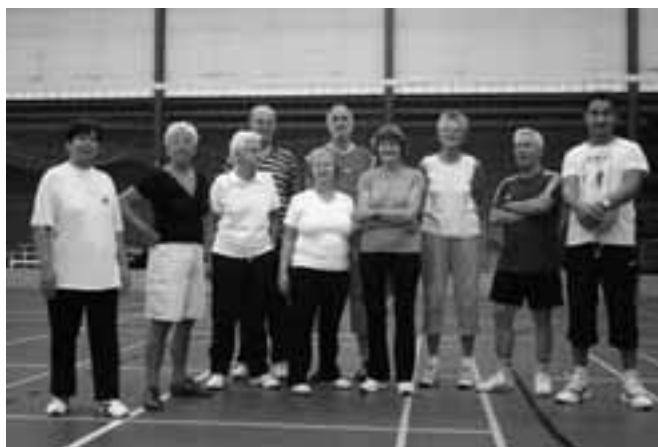
Deze enthousiaste Galmgroep is op zoek naar nieuwe leden.