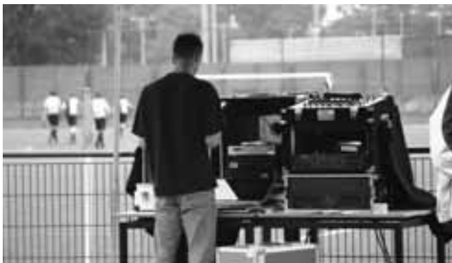
Aan geluid geen gebrek.